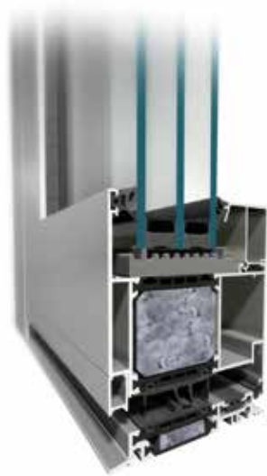
MB-104 PASSIVE SI