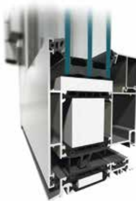
MB-104 PASSIVE Aero