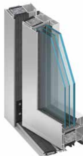
MB-104 PASSIVE SI, RC3

Exemples de coefficients de transmission thermique U_D