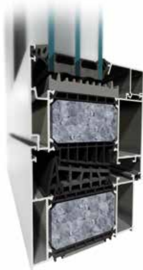
MB-104 PASSIVE SI