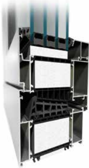
MB-104 PASSIVE Aero